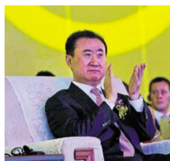
FILMFYRSTE. Kinas tredjerigste mand, Wang Jianlin, går ind i filmbranchen.

»Et stort skridt i Kinas strategi for at blive et globalt kulturelt